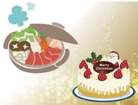
12月 忘年会、クリスマスケーキも会社から