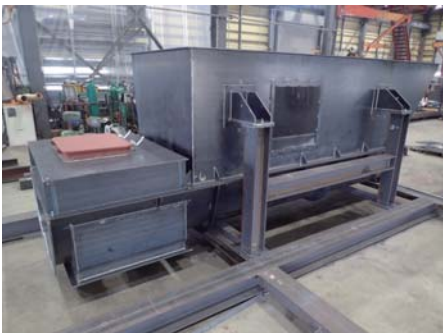
産業機械ホッパー