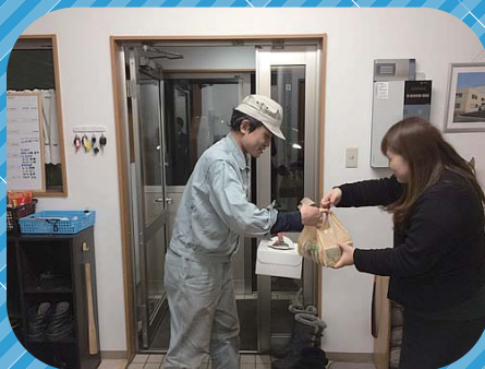
本日もお疲れ様でした。 会社からのクリスマスプレゼントです！