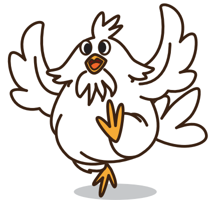
マスコット「だいちゃん」