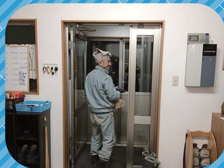
嬉しいプレゼントに思わずマッコリ！ 御家族で召し上がってください。