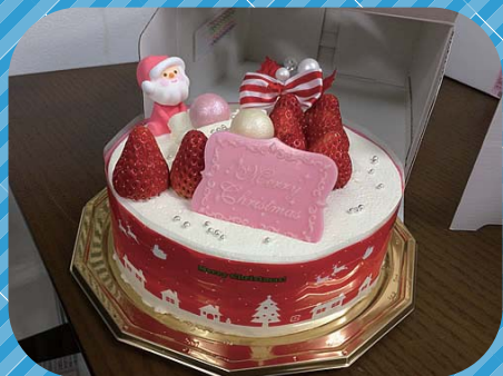
毎年クリスマスには社員全員に ホールケーキが配られます