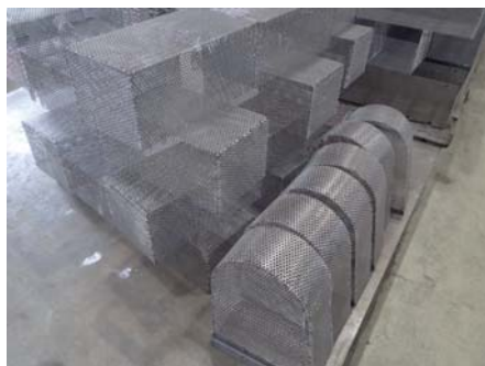
パンチングカバー