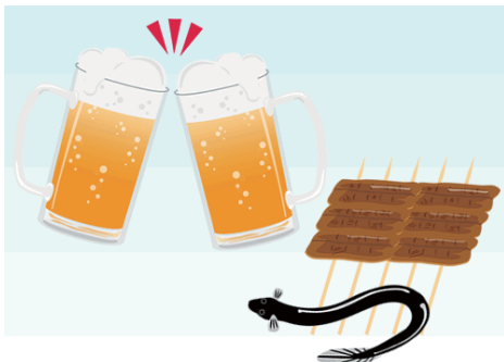
7月 夏は暑気払や鰻も