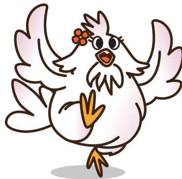
マスコット「ひなちゃん」

鉄道車両部品・水処理・熱処理機械、 ステンレス加工、各種タンク、 産業機械、製缶、 建築金物、設計製作